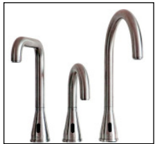
Tonga2 - Reihe in Edelstahl

für 12V Niedervolt-Netzbetrieb - - interne Elektronik "LOex Donau", E8 B - externes Steckernetzteil - 12VDC 40 34154 02317 8 TG2SE8AST90ii13 5_DMK - interne Elektronik "LOex Donau", E8 C - externer MW Trafo - 12VDC 40 34154 02318 5 TG2SE8AMT90ii13 5_DMK